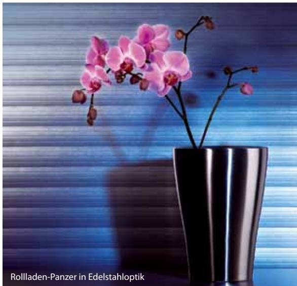
Rollladen-Panzer in Edelstahl optik